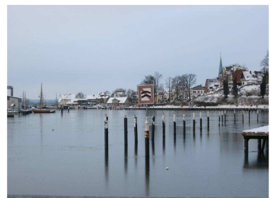
Neustadt im Winter