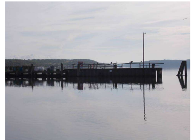
Die alte Brücke zerfällt langsam