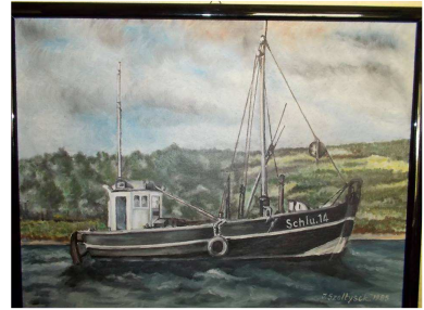
Die Lotte vor Stülper Huk

So unterschiedlich kann es sein.. unser Norden ist schön