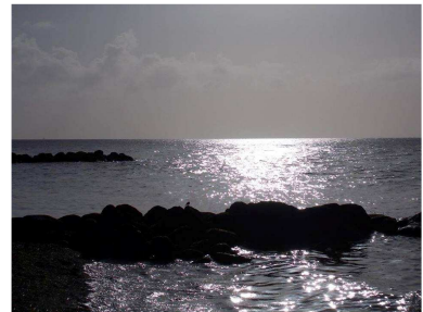
Sonnenstrahl an der Buhne